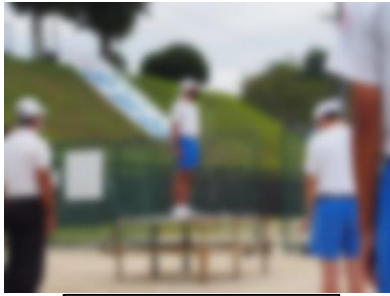
生徒会長あいさつ