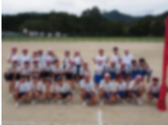
力を合わせ最後まで戦いきった紅隊