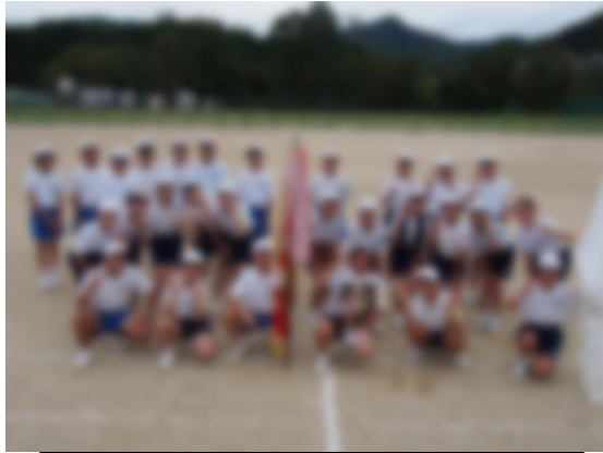
優勝旗・優勝盾を手にする白隊