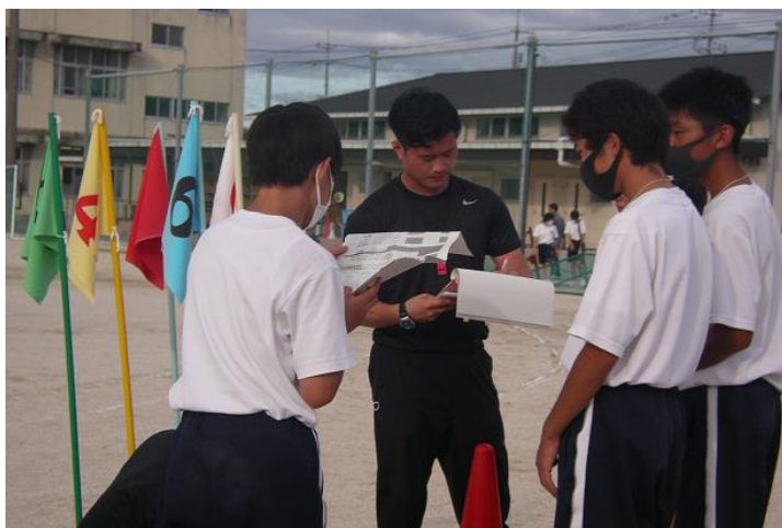
放課後の係別準備