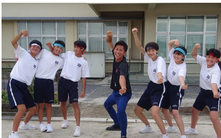
応援隊長・副隊長と