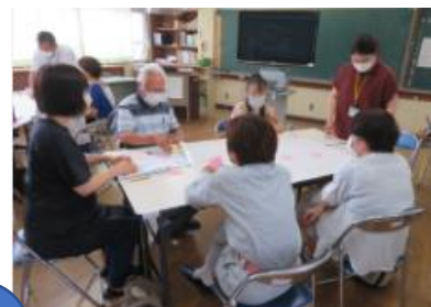
「上」グループの話合い