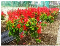
サルビア (校庭花壇)