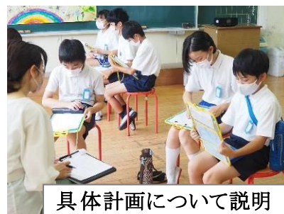
具体計画について説明

現在、5・6年生が「自分たちがする地域貢献」について、計画し、実践しようとしています。岩国西中学校、河内小学校とともに、「地域交流」「地域PR」の視点で進める取組です。7月8日には、それまで自分たちで練ってきた計画について担任以外の教員に説明し、気づきやヒントをもらって深めました。この夏休みは、実際に調査や行動を起こす時間となります。児童が地域の皆様にお尋ねやお願いにうかがうことがあると思います。お知恵やお力とともに見守り声かけ等もいただければ幸いです。どうぞよろしく願いいたします。休み明けには、その成果、気づきの上にさらに深めて行く予定です。