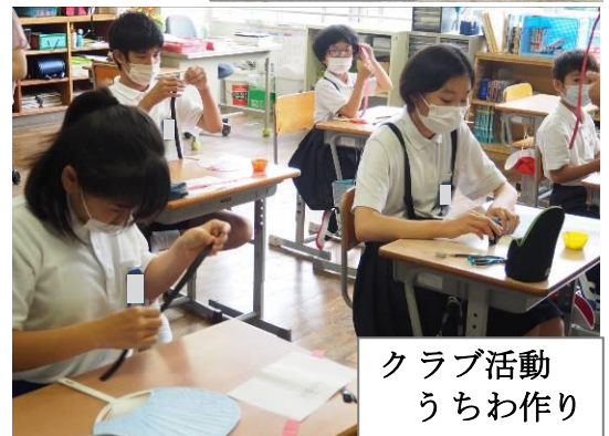
クラブ活動 うちわ作り