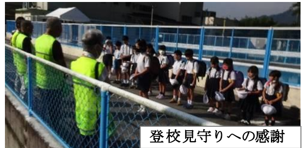
登校見守りへの感謝

全校児童27名、地域の方々の見守りや支援をいただいて、学習・活動に一杯取り組みました。7月20日に登校見守りへの感謝の思いを伝えたところ、40分かけての登校をがんばっていることをほめていただきました。児童と一緒に下校すると、「あの人は、いつも走っています」「〇〇おばあちゃんは、ここにすわって、話しかけてくれます。今日は、留守みたい」などと聞かしてくれます。足腰が鍛えられることはもちろんですが、地域の方とのちょっとしたふれあい、友達のおしゃべりなど、毎日の登下校で得るものの大きさを改めて感じています。