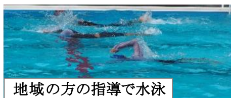
地域の方の指導で水泳

夏休み開始の21日、22日。水泳や学習に取り組みました。夏休みも、暑さに負けずにがんばります。