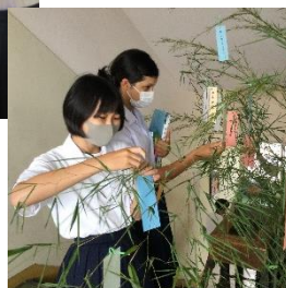
教育実習生お別れ会