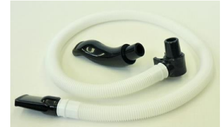
フリーホース・うた口