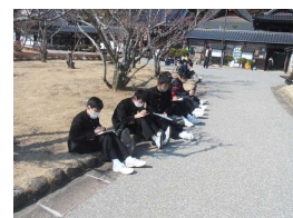
写生大会を 行いました