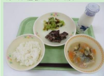
ご飯、牛乳、くじらの竜田揚げ、即席漬け、味噌汁