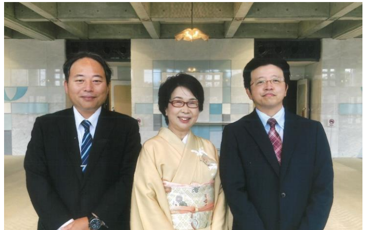
教頭 ・ 校長 ・ 教頭

新年を迎え、新型コロナウイルス感染拡大防止のため、通常に戻りかけてきた矢先に再び自粛を余儀なくされることとなりました。しかしながら、学校といたしましては、感染症対策を徹底しながらコロナ禍でもできる教育活動に取り組み、子どもたちの学びを保障して参ります。