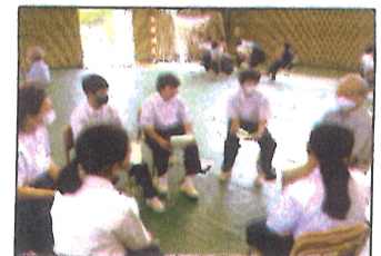
地域と方と中学生の熟議 19のグループに分かれて地域の方と話し、通津について考えました。日頃、地域について考えていることを話しあうことができました。