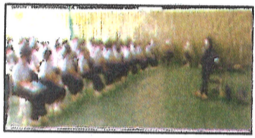
岩国徴古館学芸員による出前授業 沢瀉の人柄など通津の歴史を知ることができました。地域の方も参加され、共に通津について学びました。