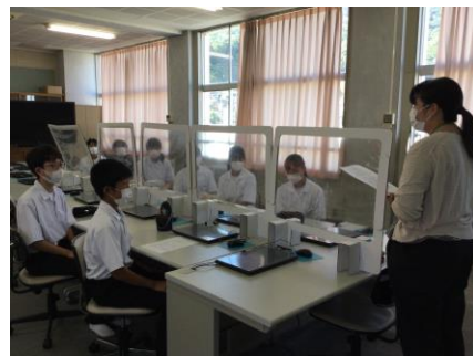
「きんたいきょう学」打ち合わせ 少人数ですが頑張ります！