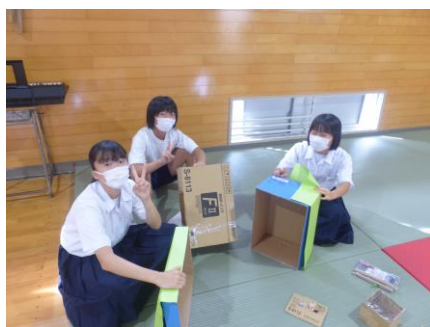
劇の小道具係 この箱はあの場面で登場しました