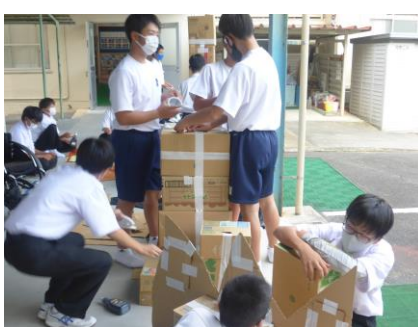
劇の大道具係 何を作っているでしょう？！