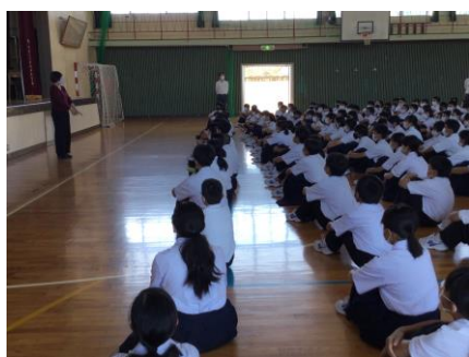
8月30日文化祭についての説明会 この日から全てがスタート！

練習の過程では様々な葛藤があったことと思います。しかし仲間と協力して何かを創り上げることの素晴らしさを感じてくれたものと思います。1年生もあと5ヶ月となりました。頑張る生徒の皆さんを心から応援しています。（文化祭本番に向けた取り組みの様子を写真でご紹介します。）