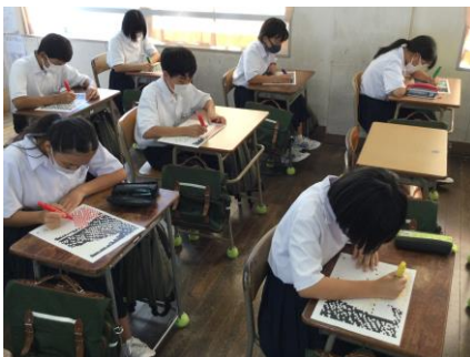
展示物作成 丁寧に集中して塗っていきます