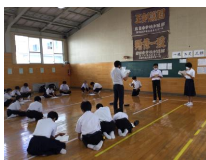
劇の俳優 台本とにらめっこ！立ち稽古中