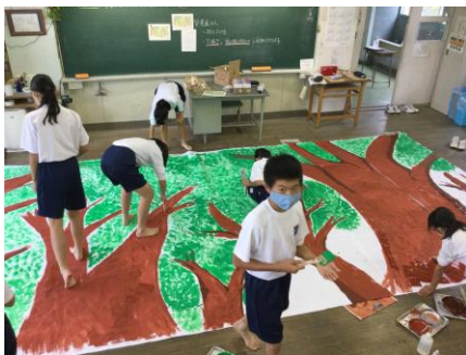
劇の背景係 存在感がすごい！