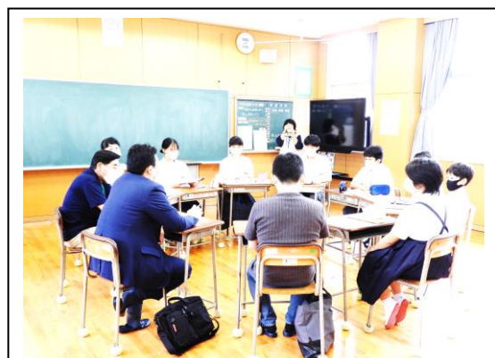
（子どもと大人のディスカッション）

また、7月9日（金）には、3校合同で実施する「子どもと大人のディスカッション（小学5・6年生、中学1・2年生が参加）」の中で、河内地区の防災学習をテーマとして話し合いを行いました。災害に対する意識を高めたり、備えを家族で話し合ったりなど、災害に対する安全教育をより一層進めていきたいと思ひます。