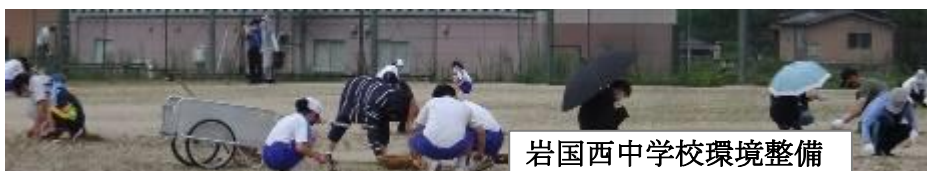
岩国西中学校環境整備

杭名小学校では、校舎内の窓ふきと運動場側溝の泥上げをしていただきました。岩国西中学校では、運動場の草引きや草刈りをしていただきました。たくさんの方々が自分たちを大事に思ってください、自分たちの学校をきれいにしようとしてくださる、そのことが一緒に活動する児童生徒のうれしさです。この思いを胸に、2学期もたくさんのご