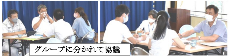
グループに分かれて協議

7月の学校評価を踏まえて、「よりよい人間関係」「学力向上」について協議しました。次のような意見が出されました。