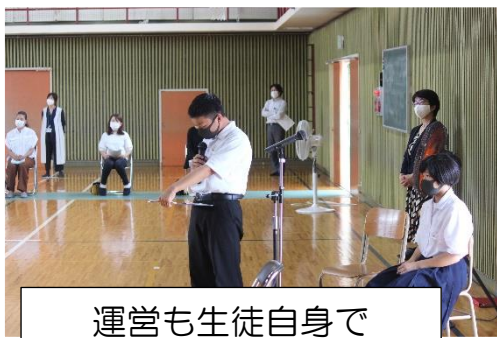
運営も生徒自身で

なお、2年生は9月30日（木）2校時に実施する予定ですので、興味のある方はぜひご来校ください。