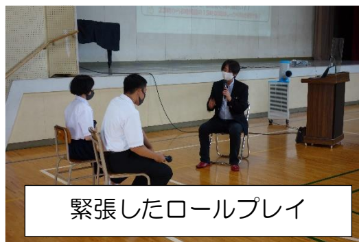
緊張したロールプレイ