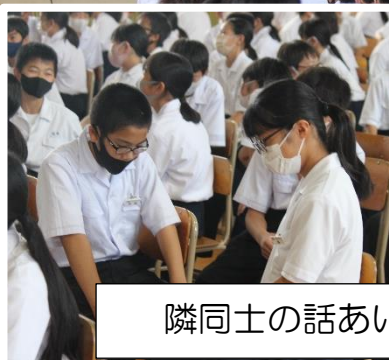
隣同士の話あいも真剣そのもの