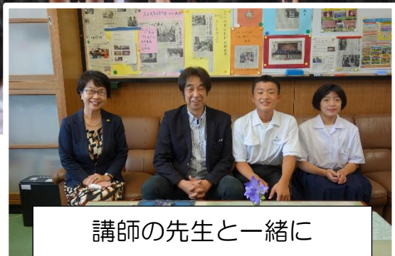
講師の先生と一緒に