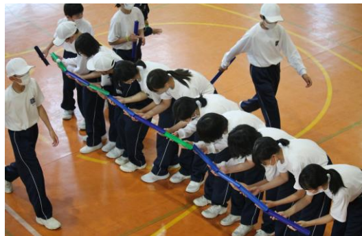
パイプラインからボールを落とさないよう力を合わせて、声かけ合って・・・