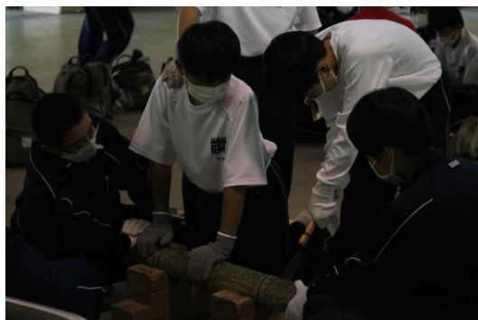
竹、おさえて～！のこぎりで切るよ。

みんなが「こんな人になるための目標を作る」というのが大変でした。1年生全員をまとめるという仕事をしたので、達成感とこれからの自信につながりました。なので実行委員をやって良かったと思います。