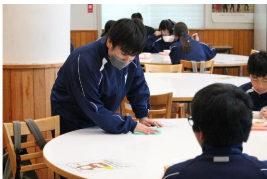
係の仕事もがんばります！（食後の台ふき）