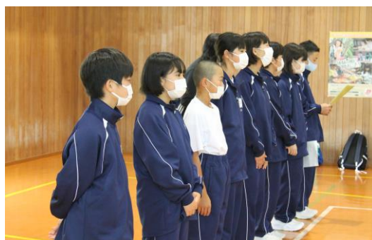
実行委員さん、立派な挨拶と進行でした。