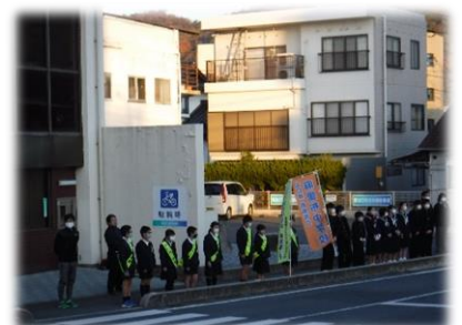
小中合同あいさつ運動

参考となりますが、山口県では、中学校区で子どもたちの育ちを見守る仕組みを「協育ネット」と呼んでいます。麻里布地域でも、「麻里布地域協育ネット」を設置しています。小中の学校運営協議会が協力した取組を充実させていきたいと考えています。