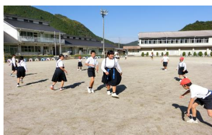
<全校遊び(しっぽ取りゲーム)>