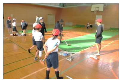
<クラブ活動(ニューズ) >