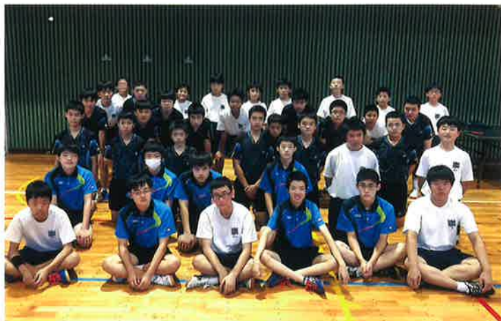
TABLE TENNIS CLUB