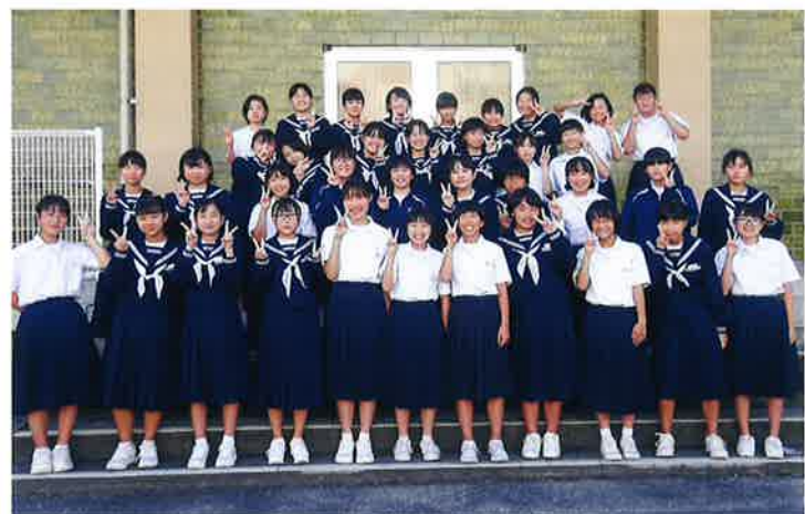
TABLE TENNIS CLUB