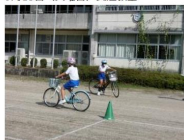
9月15日 (火曜日) 交通教室

今日は、自由研究発表会 (参観日) でした。1年生から6年生の全員が、夏休みに取り組んだ自由研究について、実物とモニター画面を用いて発表しました。理科だけでなく、社会科的なものや図工的なものもあり、一人ひとりの個性が光っていました。見守り・協力してくださったご家族の方々、ありがとうございました。