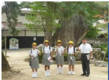
9月24日 (木曜日) 25日 (金曜日) 修学旅行

安全は、自転車の点検からです。交通ルールを守って安全運転を心掛けてほしいものです。