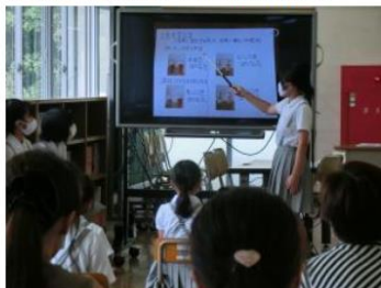
9月3日 (木曜日) 自由研究発表会

今日は、自由研究発表会 (参観日) でした。1年生から6年生の全員が、夏休みに取り組んだ自由研究について、実物とモニター画面を用いて発表しました。理科だけでなく、社会科的なものや図工的なものもあり、一人ひとりの個性が光っていました。見守り・協力してくださったご家族の方々、ありがとうございました。