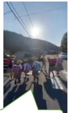
止まってくれた車に頭を下げる子どもたち♪

あいさつは、相手に伝えることが大切で、それによってお互いが気持ちよく（嬉しく）なれるという良さがあります。