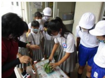
9月1日 (火曜日) スイカ割り

教頭先生が学校の花壇に、植えた苗から一玉スイカができあがりました。いよいよ、できばえを確認すべく、スイカを包丁で二つに割ってみました。見事に赤く甘いスイカになっていたもので、みんなで美味しくいただきました。