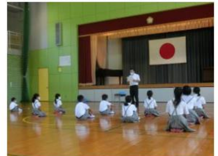
8月24日(月曜日) 2学期始業式

学校の環境整備作業に多くの保護者や地域の方々が来校され、草刈りや草抜き、溝の泥上げ、樹木の選定・伐採、グラウンドならしなど、日ごろ学校でできないことをしてくださいました。お陰様で素晴らしい環境となりました。ありがとうございました。