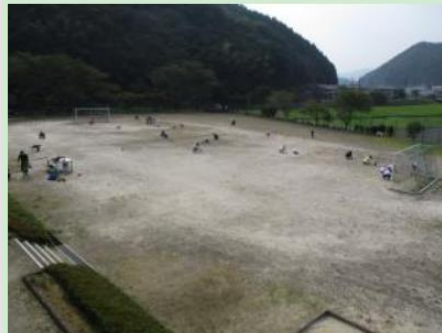
8月22日(土曜日) 環境整備作業

学校の環境整備作業に多くの保護者や地域の方々が来校され、草刈りや草抜き、溝の泥上げ、樹木の選定・伐採、グラウンドならしなど、日ごろ学校でできないことをしてくださいました。お陰様で素晴らしい環境となりました。ありがとうございました。