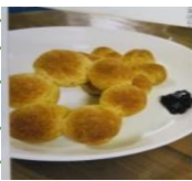
円形ドーナツ (6年作)

新型コロナウイルス対応の関係で、外部の方の来校をご遠慮いただいていたが、6月からWITHコロナの中で、安全対策を行ったうえで、地域とともにある学校づくりを進めております。ご理解・ご協力をよろしくお願いいたします。