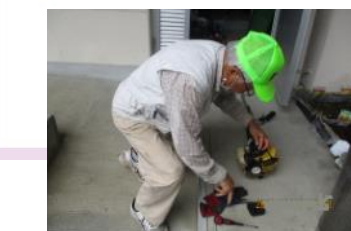
草刈り機も修理していただきました。