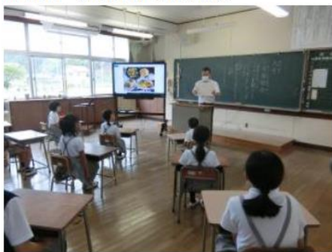
6月1日（月曜日）月頭朝会

早いもので、6月になりました。全校集まって月頭朝会を行いました。校長先生がCS（コミュニティ・スクール）の話をされました。川上小学校は、学校と家庭と地域が一緒になって教育を行っているCSということが分かりました。