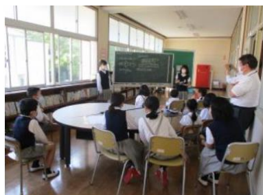
全校で話し合っ決めてました。