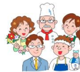
ちいきのみなさんも