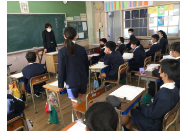
【国語の授業の様子】