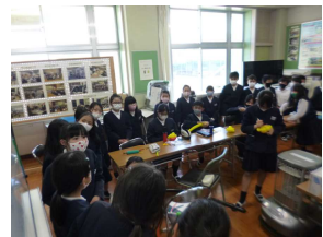
【クラブ見学の様子】

3年生は説明を聞いたり様子を見たりして4年生になって入りたいクラブを考えていました。