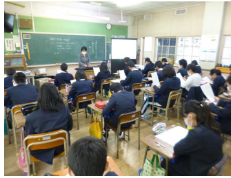
【音楽の授業の様子】

また、2月5日(金)に川下中学校で入学説明会と学校見学会が実施され、6年生とその保護者の方が参加しました。中学校の生活の様子について説明を聞いたり、部活動の様子を見学したりしました。