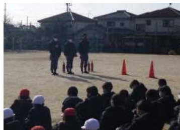
【消防署の方のお話】

火災の原因で多いのは、「たばこの火の不始末」だそうです。「料理中の油への引火」もけっこうあるそうです。冬は空気が乾燥し、火が燃え広がりやすいので、十分火の取り扱いに気をつけてくださいとのことでした。