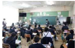
【5年生算数科の授業】