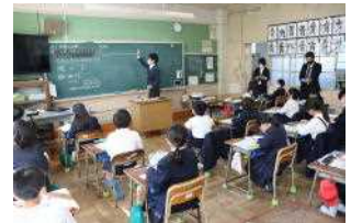
【3年生算数科の授業】