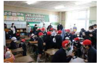
【2年生外国語活動の授業】

1月20日（水）に、「岩国市小中一貫教育に係る確かな学力推進研究事業」の公開授業研究会を行いました。本校の全教員のほかに、川下中学校や愛宕小学校の先生方も参加されて、2年生では「外国語活動」、3年生と5年生では「算数科」の授業を公開し、「自分の考えをもち、表現できる児童の育成」に向けた取組について協議をしました。