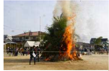
【とんど焼きのようす】