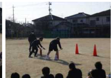
【消火器を使った訓練】