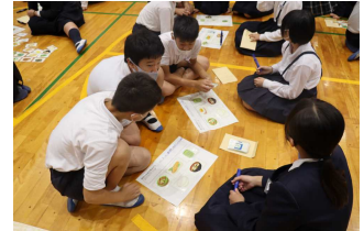
【児童の活動の様子】

テーマは「生活習慣を整えよう」です。子どもたちの心と体の成長のためには、生活習慣を整えることが大切なことのひとつとされています。今回は、話題を「朝食」に絞って行いました。「朝食」の役割を学習した後、ペアになって朝食メニューを考えました。