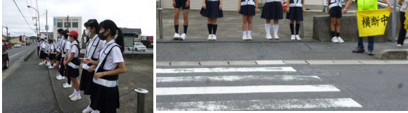
【あいさつ運動の様子】

7月からあいさつ運動を始めています。今年度は新型コロナウイルス感染予防を行いながら実施しています。