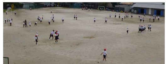
【昼休みの運動場の様子】

2学期が始まってから暑い日が続き、熱中症予防のため、外での活動を控える日が続きました。9月になってからは暑さも落ち着き、外で運動もできるようになりました。昼休みには外で元気よく遊ぶ子どもたちの姿が多く見られます。