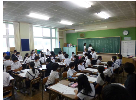
【代表委員会の様子】

代表委員会で決まったキーワードをもとに、各学級でスローガンを考えます。新型コロナウイルス感染予防を行いながらの実施となる運動会ですが、子どもたちは運動会に向けて少しずつ意識を高めてきています。なお、運動会につきましては後日改めてご案内いたします。