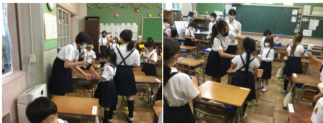
【プレゼントを渡した6年生と受け取った1年生の様子】

縦割り班での活動の再開に向けて準備を進めております。今後、感染防止の取組を継続しながら、子どもたちのあたたかい心を育むための活動を取り入れていきたいと思っております。