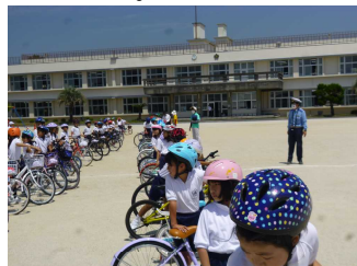
【3年生交通教室の様子】

学校では、ヘルメットの着用や飛び出しをしないことなど、自分の命を守るための約束を伝えています。