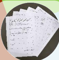
自分の学びや成長を見つめるキャリアサポート