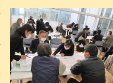
カリキュラムづくり、改善も地域と共に