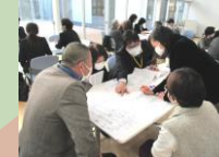
教職員や保護者、子ども等の評価をもとにしたカリキュラムの改善