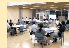
マスコットキャラクター～アイちゃん～

「ふるさと愛ネット」の仕組みを生かして、家庭・地域・学校の確かな連携のもとで、小中一貫教育を推進