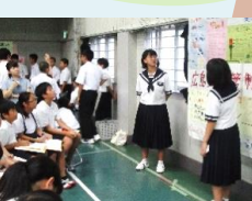
教育活動全体を通して、キャリア教育を実践

キャリア教育のキャリア教育カリキュラム(めざす子ども像を発達段階毎に整理)による系統的な指導