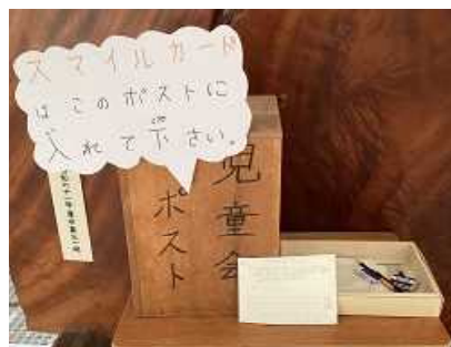
【メッセージカードと児童会ポスト】

「履き物をそろえる」ことにも継続的に取り組んでいます。生活安全委員会の子供たちは、休み時間に各学年のトイレスリッパを確認し、よくそろっている学年をお昼の放送で紹介することで全校の子どもたちが取り組んでいます。まもなく小学校卒業を迎える6年生は、下校後の靴箱もしっかりそろっていました。最高学年として本当によいお手本になっています。