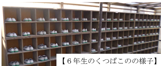
【6年生のくつばこの様子】