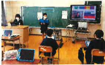
「二分の一人式」 (4年生)

2/17(木)に予定されていた参観日が、まん延防止等重点措置の影響で2/24(木)に変更となりました。延期された1週間分、練習時間が増えたので、「二分の一人式」、「しあわせ総会」の本番に向け、それぞれの学年で工夫しながら練習しました。「なわとび大会」へ向けては、個人種目に加え、全校種目の練習もがんばりました。