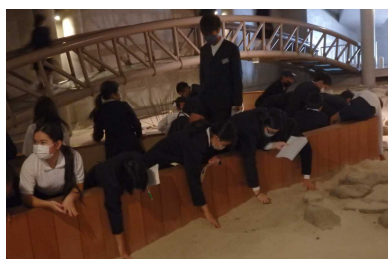
【修学旅行での体験や見学の様子】