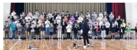
励ましの言葉をお願いします(6年生 音楽会の練習)