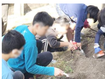
いろいろな形のサツマイモがとれました (さくら学級 いもほり)