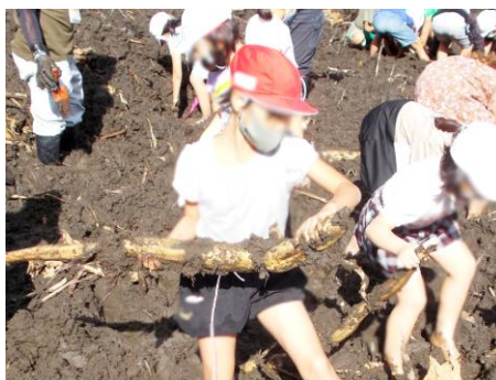
お手伝いのみなさん、ありがとうございました (3年生 レンコン掘り)