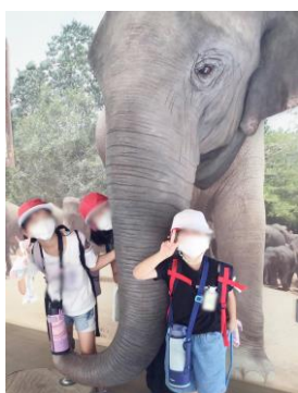
天気のよい一日でした (2年生 徳山動物園)

10月になり、学年単位の学習が行われています。今回は、その一部を紹介しします。また、修学旅行が延期となった6年生は、音楽発表会に向けた練習にも励んでいます。