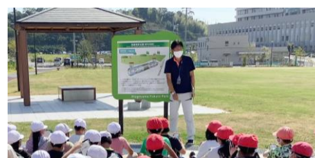
防災交流拠点の見学 (4年生 ふくろう公園)