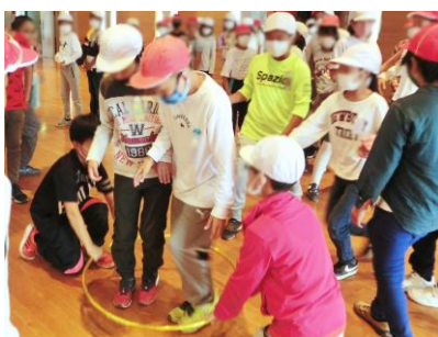
友達との絆を深めました (5年生 自然教室)