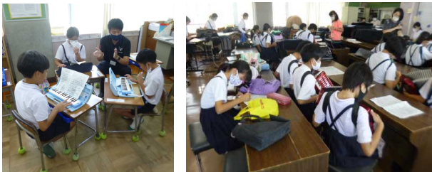
【グループに分かれて練習する様子】

2学期に入って、音楽の時間を中心に練習を続けていきます。きっとすてきな演奏を聴かせてくれることと思います。