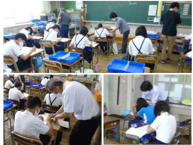
【「あったか塾」での学習風景】

今年度は、3日間で延べ約180名の児童が参加しました。新型コロナウイルス感染状況を踏まえ、本校の教員と川下中学校の先生方で各教室に分かれ、個別に指導を行いました。