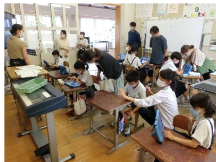
<タブレットを使った学習風景(7月参観日)>

また、小中一貫教育が本格化し、岩国中学校区の4つの小学校と1つの中学校の子どもたちや先生方、そして地域が一体となり、子どもの成長を支える教育も動き出しています。