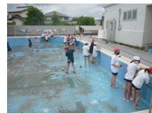
【プール掃除の様子】

6月15日(火)の午後に6年生がプール掃除を行いました。プール内の壁面や床面だけでなく、プールサイドや更衣室やトイレなど細かいところまでしっかりきれいにしました。