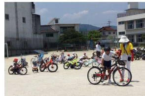
【交通安全教室の様子】

6月8日(火)の3・4校時に、3年生が自転車を使った交通安全教室を行いました。自転車に乗るときのルールや気をつけること、自転車は「車両」であり加害者にもなることなど、警察の方から教えていただきました。