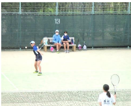
ナイスコース! (対 高森みどり中)