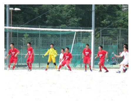
ナイスディフェンス! (対 川下中)