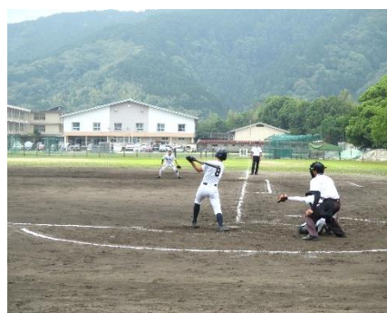
ナイスバッティング! (対 岩国中)