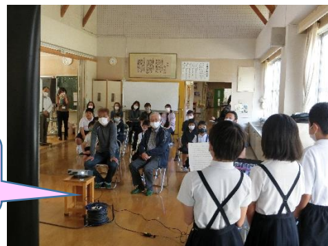
< 5月9日(日) 学校運営協議会での発表の様子 >

「今年もホタルが見られるかな?」「川で蛙のきれいな鳴き声を聞いたよ」「家の近くで黄色い鳥を見たよ」子どもたちが、私に話しかけてくれます。知らず知らずのうちに感じたことや見たこと、ふれあったことが子どもたちにとってはふるさと師木野のよさに変わっていくことでしょう。