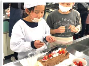
【クリスマススイーツ料理教室】