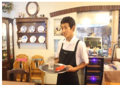
ステーキハウス錦南