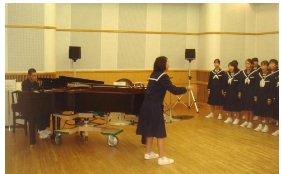
シンフォニアでの直前練習