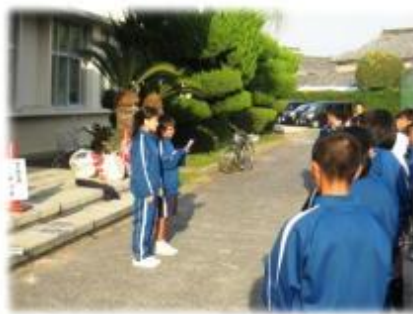
【中学生代表挨拶（閉会式）】