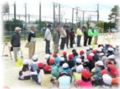
【避難訓練を終えて】

いざというときの対応について、よい訓練ができたと思います。また、自分たちはいつも地域の方に見守られていることを実感できた訓練でもありました。