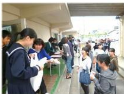
【保護者に引き渡し】