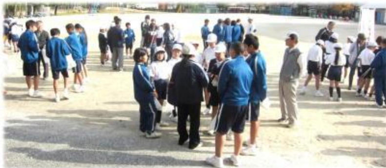
【開会式後の打合せ】

11月15日（火）の午後、川下中、愛宕小、川下小3校合同の「校区内クリーン大作戦」を実施しました。川下小学校区では、14の地区ブロックに分かれ、各地区のゴミ拾いや公園の草抜きなど、小中学生、保護者、地域の方が一緒に清掃活動をおこないました。最後は全員が小学校にゴミを持ち帰って分別しました。児童の感想を見ると、「ゴミの多さに驚いた」「地域をきれいにして気持ちよかった」「またやりたい」「中学生の人と一緒に協力できたことがよかった」など、今回の取組が子ども達にとって大変充実したものであることが感じられました。