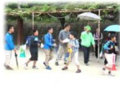
【地域の方に見守られて下校】