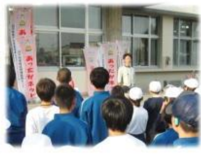
【地域コーディネーターのお話】