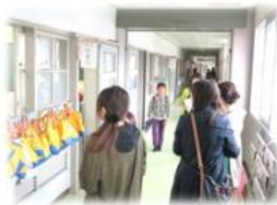
【我が子の出迎えに来校】