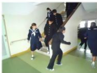
【グラウンドに避難】