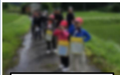
バードウォッチング