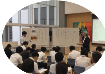
教職員も学びました！