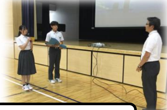
感謝の気持ちを伝える！