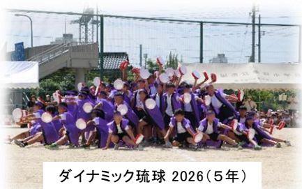
ダイナミック琉球 2026(5年)