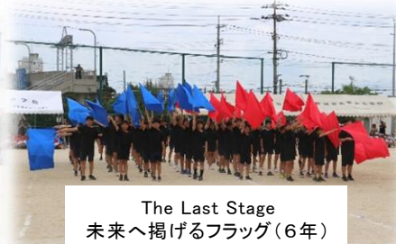
The Last Stage 未来へ掲げるフラッグ(6年)