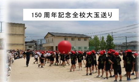
150周年記念全校大玉送り