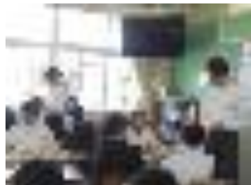
生徒会役員は1,2年生の学級討議のヘルプに向かっています。