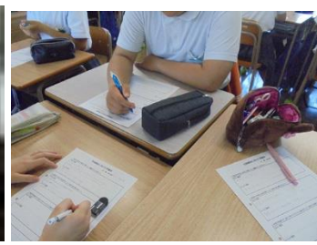
一生懸命考えて、書き込んでいます。