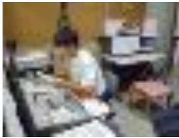
生徒会長からの趣旨の説明

今年の議題は「挑戦～愛で麻里布（ふるさと）を身近に～」です。それに先立ち学級討議が行われました。