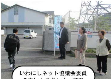
いわにしネット協議会委員 の方によるあいさつ運動

いわにしネットの取組により、子どもたちは多くの大人と触れ合い、様々な価値観や考え方に触れるとともに、大人が真剣に取り組んでいる姿を見て、あこがれや地域への愛着が増し、思いやりの心や社会性、責任感といった「生きる力」を育むことにつながることでしょう。さらに、いわにしネットの取組が、地域の大人同士の交流や助け合いの輪の広がり、地域の方のやりがいなどにつながれば幸いです。