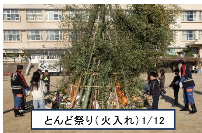
とんど祭り(火入れ)1/12