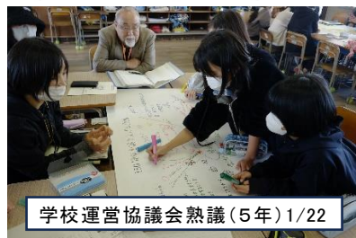
学校運営協議会熟議(5年)1/22

■成人の日に、毎年恒例の「あたとんど祭り」が開催されました。神事後、今年年男と年女になった5年生の代表が火入れを行い、一年の無病息災を願いました。また、体育館では4年生の有志が運動会で踊ったソーラン節を披露してくれました。