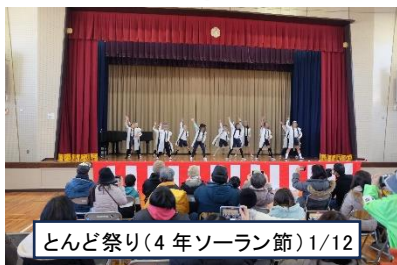
とんど祭り(4年ソーラン節)1/12