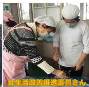
食生活改善推進委員さんと調理実習