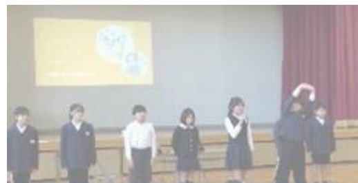
↑保健委員会の発表 / ストレッチの様子↓

睡眠は身近な話題でありながら奥が深く、児童一人ひとりがこれから健康な体と心をつくるために有意義な時間となりました。