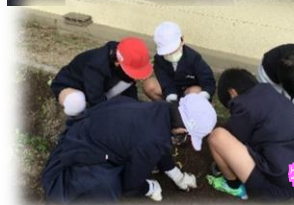
特別支援学級「いもほり」