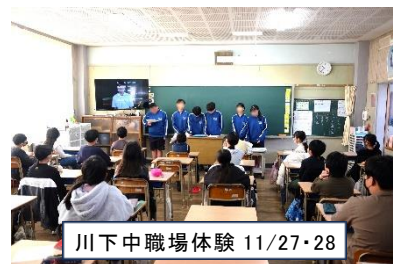
川下中職場体験 11/27・28